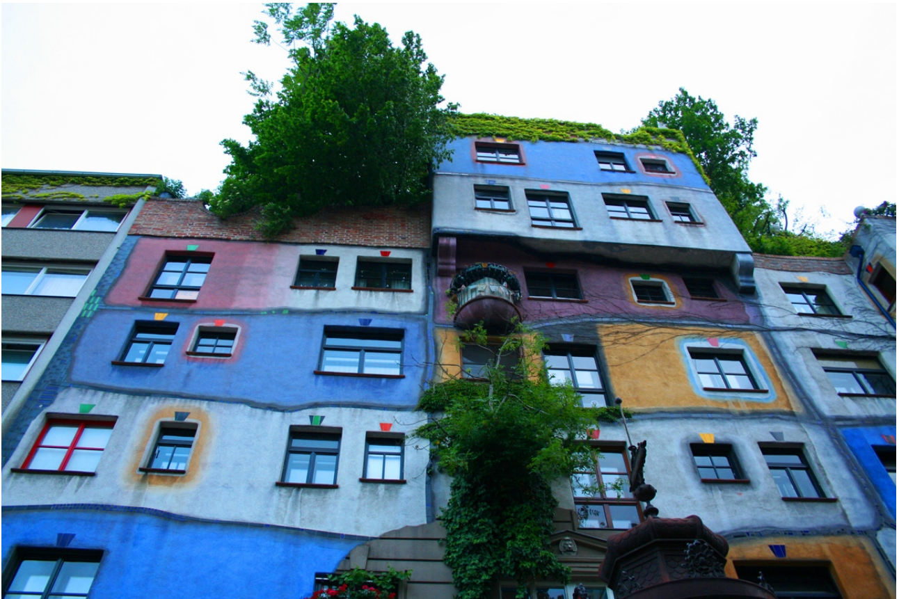
Hundertwasser, Krawinahauss na Dunaju, 1986