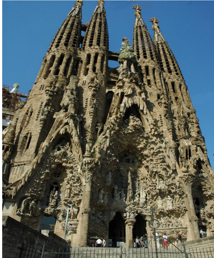
Gaudi, Sagrada familia, 1882

Kompozicijska načela so načini, po katerih se v likovnem oblikovanju posamezni deli učinkovito povezujejo med seboj in na ta način vzpostavljajo likovni red.