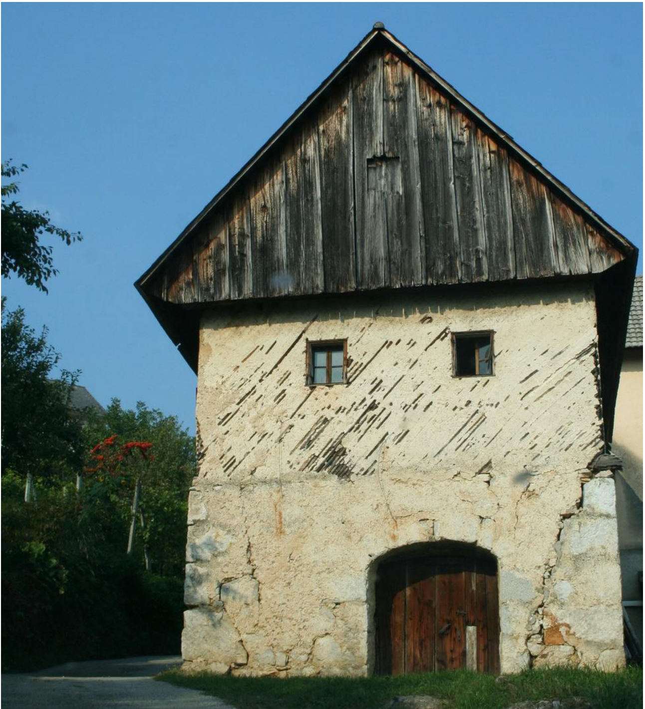
Zidanica v Beli krajni

Pri uravnavanju kompozicije je pomembno, da uravnatežimo elemente, ki so si različni. Različni so si lahko po masi, barvi, teksturi ali zglajenosti površine itn. Zato ima pri uravnavanju kompozicije v arhitekturi pomembno vlogo tudi material. Vsak material ima svoje lastnosti, ki določajo obliko in učinek arhitekture. Prav skozi materialnost arhitektura dobi svojo obliko ter v nas vzbuja določene občutke. Les deluje lahko, toplo, prijetno. Steklo deluje hladno in strogo, vendar elegantno. Kamen vzbuja občutenje narave, opeka vnaša v prostor domačnost, beton pa učinkuje težko, hladno, resno. Tradicionalni materiali imajo s svojimi barvami in teksturami pomen tudi na sami kulturni identiteti, ki jo nosi določena pokrajina. Prav to identiteto krajine bi morali arhitekti nadvse skrbno negovati.