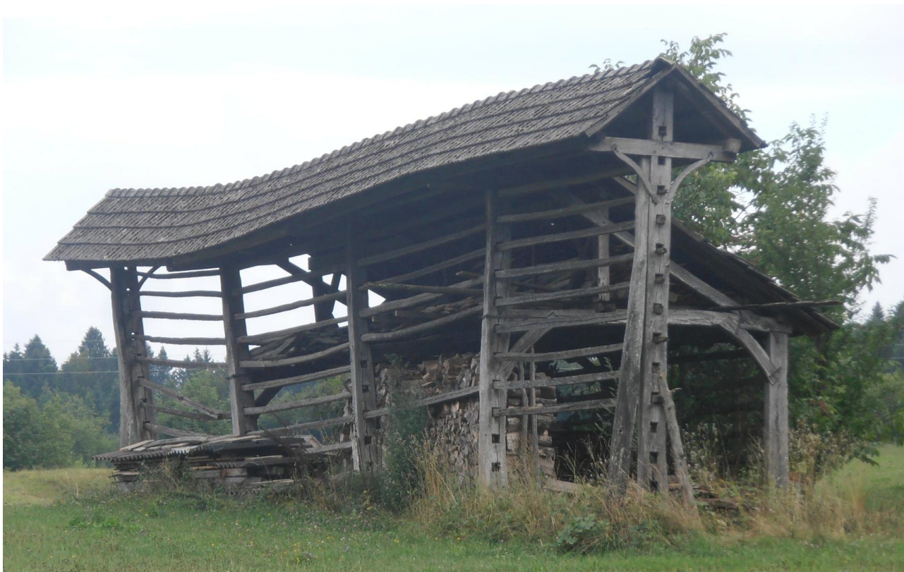
Kozolec v Rumanji vasi

Verjetno si v preteklih letih že mešal na paleti podobne, harmonične barve in z njimi slikal. Harmonija nastane takrat, kadar so si likovnimi elementi med sabo podobni. V arhitekturi je to odnos med različnimi elementi prostora, ki so skladni s celoto oziroma so z njo v sozvočju. Harmonija lahko nastane tudi med samo stavbo in okoljem, v katerem je stavba postavljena. Manj kot je v določeni stavbi nasprotujočih si lastnosti, več je ubranosti - harmonije.