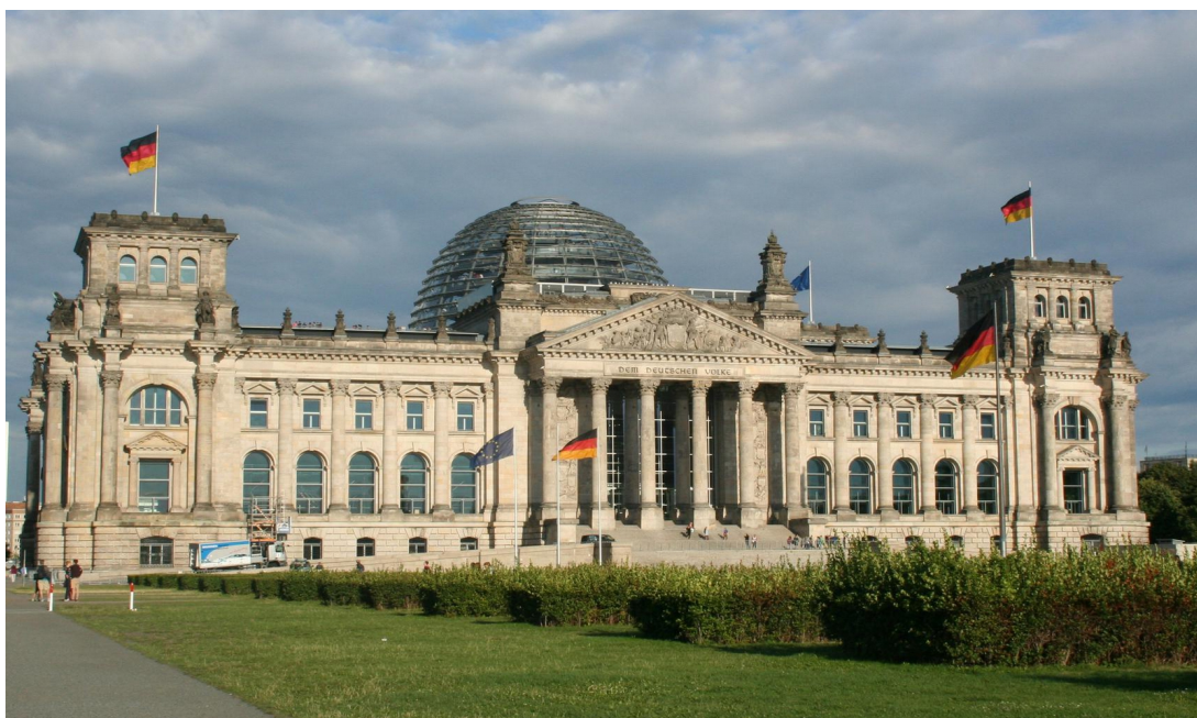
Paul Wallot, Reichstag v Berlinu, 1894