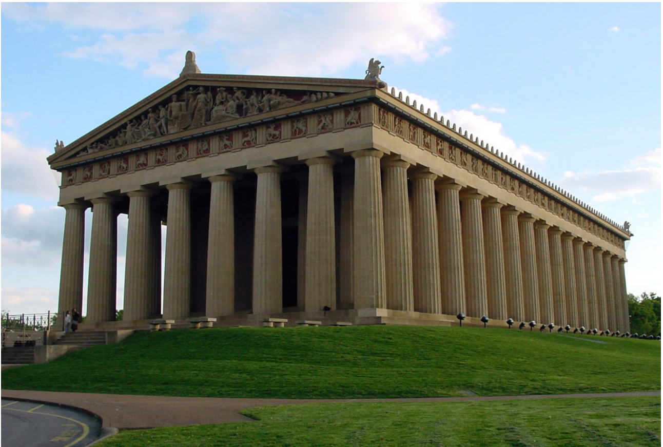
Partenon, 5. stoletje pred našim štetjem

Različne arhitekturne elemente je treba med seboj uravnovežiti, da dosežemo občutek usklajenosti. Kadar je kompozicija oblikovana simetrično, deluje umirjeno, statično. Stavbni členi so enakomerno razporejeni na levi in desni strani. Kadar so elementi arhitekture urejeni asimetrično, kompozicija deluje bolj razgibano, dinamično. Tudi pri asimetričnem komponiranju stavbnih členov mora arhitekt elemente med sabo uravnovesiti. Ravnotežje oblikuje s pomočjo razporejanja mas, smeri, velikosti, položajev, števila in tekstur.